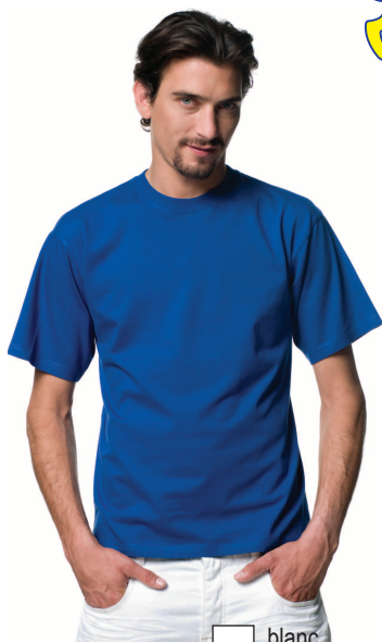
T-Shirt 100% Coton Tailles S - XL 9.- XXL 12.- blanc gris-clair mi-bleu rouge jaune bleu foncé noir