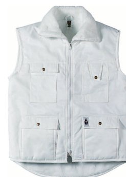
Gilet Worker Résistant au vent et à l'eau beaucoup de poches pratiques blanc bleu-foncé noir Tailles S - XXL 62.-