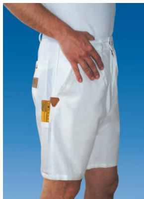
Shorts avec 2 poches pour le mètre Tailles 38 - 64 Prix Fr. 29.-