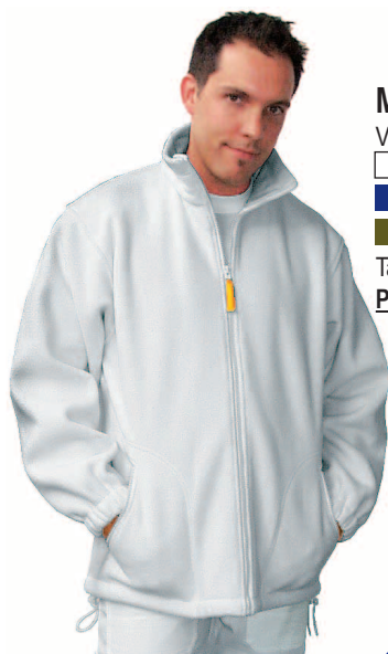
Montana Veste fleece blanc bleu-foncé vert-olive Tailles S - XXL Prix Fr. 59.-