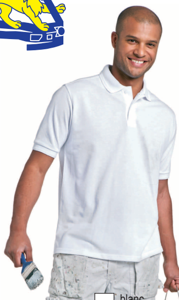
Polo-Shirt Qualité robuste Tailles S - XXL 24.- sans poche 18.- blanc gris rouge mi-bleu bleu-foncé noir