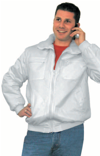
Veste de pilote Coton//Polyester résistante à l'eau et au vent, très solide, doublée blanc autres couleurs dans notre shop online Tailles XS - XXL Prix Fr. 99.-