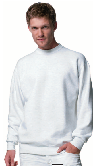
Sweat-Shirt Tailles S - XXL 28.- blanc gris-clair rouge mi-bleu bleu-foncé noir

Conditions: Prix sans TVA. Paiement 30 jours net. Valeur minimum par commande Fr. 50.- net.