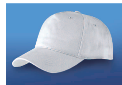
Cap blanc Couleurs sur demande Prix Fr. 5.-